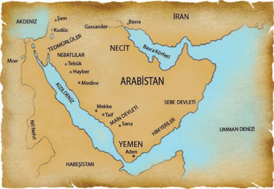
Hz. Muhammed (sav) dönemi Arap yarımadası

Arkadaşlar bizim bakış açımız böyle olduğu için, Peygamber Efendimizi anlamada ve onun güzelliklerini çağımıza taşımada işe temelden başlamaya karar verdik. Şimdi bu kısa girişten sonra ilk dersimize başlayabiliriz.