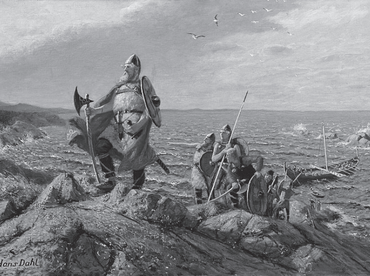
Leif Eriksson (Kızıl Erik'in oğlu) Amerika'yı keşfediyor. (Hans Dahl, 1849-1937)