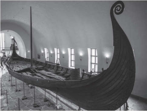
Vikingler bu kayıklarla engin denizlere açılırlardı.

Erik de diğer Vikingler gibi, savaşırken ölen bir adamın doğruca Valhalla dedikleri cennete gideceğine inanırdı. Savaşa istekleri o kadar kuvvetliydi ki ortada hiçbir düşman bulunmazsa kendi aralarında kavga ederler, ikiye ayrılır, birbirlerinin üstüne atılır ve ölesiye vuruşurlardı. İşte Vikingler bu kadar ateşli adamlardı, aynı zamanda pek mahir denizciydiler. Bir salapurya büyüklüğündeki gemileriyle en korkunç, fırtınalı havalarda bile şimalin (kuzeyin) sert denizlerine açılmaktan korkmazlardı. Erik ile babasının yurtlarından uzaklaştırılmalarına sebep olan bu kavgalar