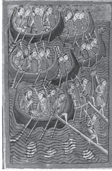
Danimarkalı denizciler (12. yüzyıl ortalarındaki çizim)

Erik'in kurduğu koloni 350 yıl kadar sürmüştü, sonra Norveçliler, memleketlerinde patlak veren müthiş hastalıklar yüzünden uzak yerlere gemi yollayamadılar ve Grönland'deki kardeşlerini unuttular. Yardımsız kalan koloni ise günden güne çöktü, gittikçe kırdıldı... Nihayet Eskimolar buralara gelip yerleştikten sonra bu eski boyar (beyaz) soy onların arasında büsbütün eriyip kayboldu.