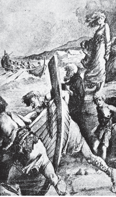
Fırtınada denize açılmaya hazırlanan Vikingler: Çok rüzgârlı bir havada, deniz köpürüp dururken Vikingler bir yolculuğa çıkmak üzere kayıklarını denize indiriyorlar.

oluyordu. O zaman Erik 32 yaşında ve evliydi. Vücudu çelik kadar sağlamdı. Bu korkunç dev bir kere kızarsa artık gözüne bir şey görünmezdi. Son kavgasında etrafa öyle saldırmış, üzerine atılanlardan o kadar çok adamın üstesinden gelmişti ki, gemileri hazır oluncaya kadar arkadaşları onu bir yere kapatmak mecburiyetinde kalmışlardı. Nihayet kendini seven birkaç dostu ve köleleriyle kayığına bindi ve engin denizlere açıldı. Nereye gideceğini bilmiyordu. Norveç'e de dönemezdi... Yalnız batıya doğru gidecek olursa önüne bir kara çıkmasının ihtimal dahilinde olduğunu biliyordu. Vaktiyle bir Norveçlinin yolunu şaşırarak batı tarafında buzlarla örtülü bir