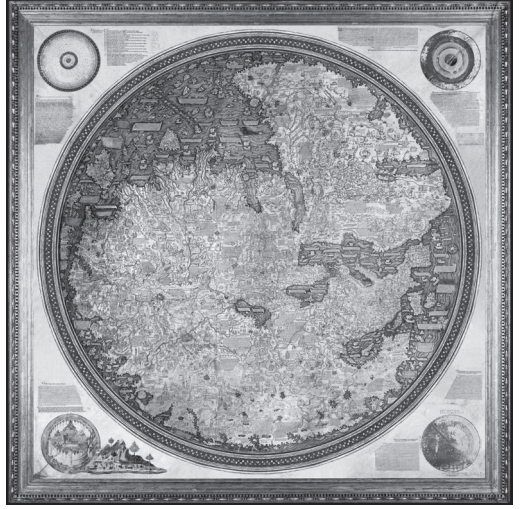
Eski Dünya'nın haritası (Fra Mauro, 1459)

Erik, İzlanda'ya geldikten sonra da geçimsizliklerinde devam etti. Bu soğuk adada kendisi gibi kafaları ateşli başka gençler de vardı. Bunlar, aralarındaki kanlı kavgaları o kadar ileri götürmüşlerdi ki, İzlanda parlamentosu da dayanamamış, Erik ve adamlarını adadan üç sene müddetle sürmeye karar vermişti. Buradan çıksınlar da nereye isterlerse gitsinler, deniyordu.