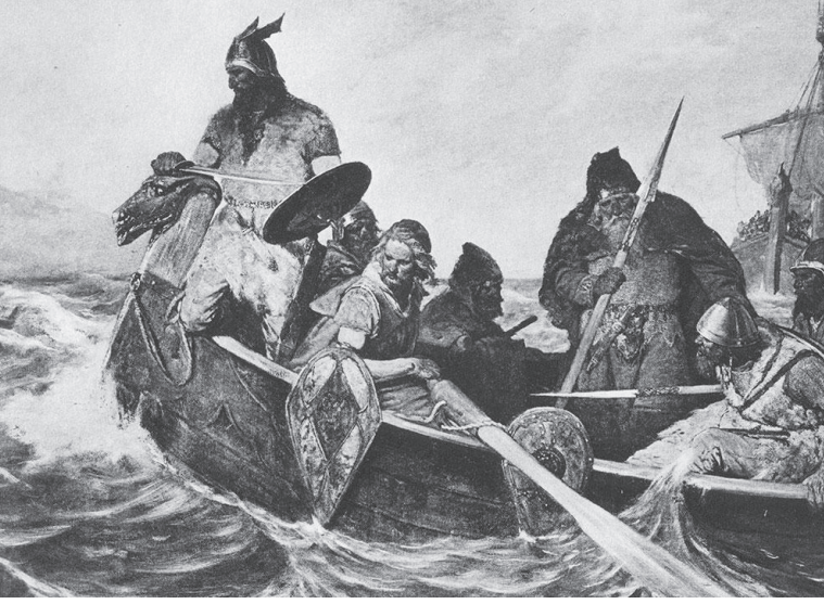
Amerika'ya varan Vikingler: Vikingler, Kristof Kolomb doğmadan beş yüz yıl önce amerika kıyılarına vardılar.